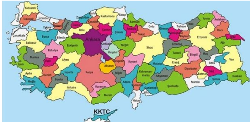
Şekil 2. Türkiye İller Haritası Gaziantep Konumu