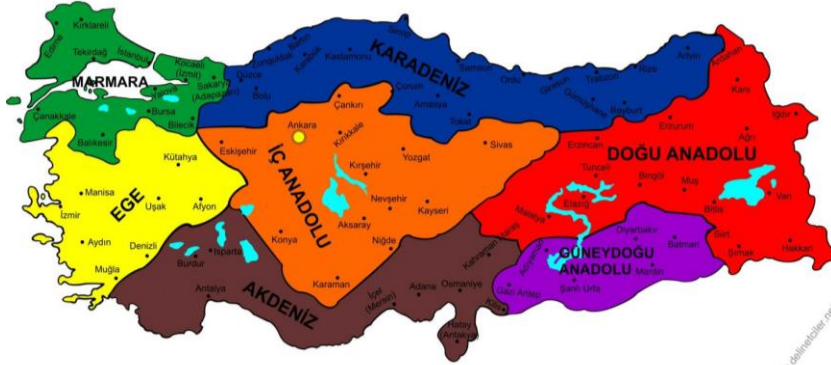
Şekil 1. Türkiye Bölgeler Haritası Gaziantep Konumu

Gaziantep, Güneydoğu Anadolu Bölgesi'nin en büyük, Türkiye'nin ise 6. büyük ili olup nüfusu, ekonomik yapısı, turizm potansiyeli ve büyükşehir statüsü ile bir metropol şehirdir (Şekil 1). İlin doğusunda Şanlıurfa, batısında Osmaniye ve Hatay, kuzeyinde Kahramanmaraş, güneyinde Suriye, kuzeydoğusunda Adıyaman ve güneybatısında Kilis illeri bulunmaktadır (Şekil 2). Merkezde Şahinbey, Şehitkamil, Oğuzeli olmak üzere Nizip, Karkamış, İslahiye, Araban, Yavuzeli ve Nurdagi olarak toplam 9 ilçeden oluşmaktadır (Şekil 3).