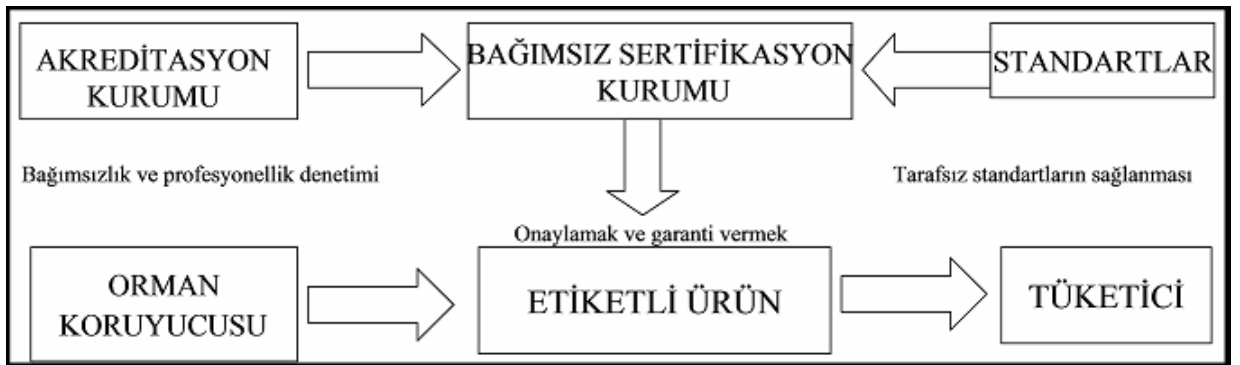
Şekil 2. Başarılı bir sertifikasyon uygulaması unsurları