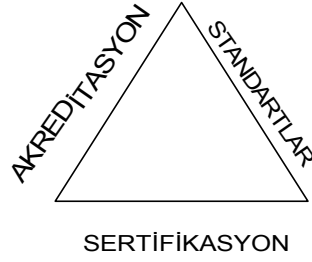
Şekil 1. Güvenilir bir sertifikasyon planı öğeleri

Üretici, pazarlamacı veya tüketici arasındaki ortak dil olarak tanımlanmakta olan standartlar aslında kriter ve göstergeleri kapsayan genel bir kavramdır. İşletme faaliyetlerinin kontrol altına alınarak, hem üretimin sağlanması hem de çevreye olan etkilerin asgari seviyede tutulması amacıyla, uluslararası temelde geliştirilen standartlar açık, anlaşılır, denetlenebilir ve ölçümlenebilir olmalıdır.